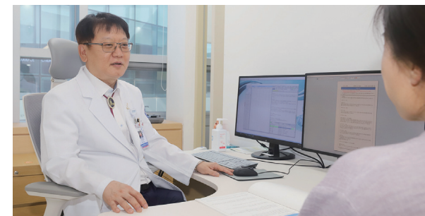
Мэргэжлийн эмч, мэргэжилтэний зөвлөгөө [VIP үйлчилгээ]