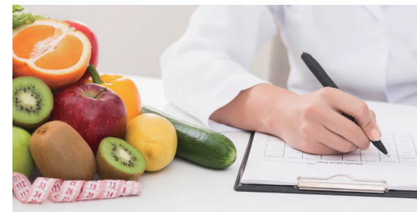
Мэргэжлийн шим тэжээлийн багаас таны өдөр тутмын хоолны хэв маягт үнэлгээ хийж, үйлчлүүлэгч тус бүрт тохируулан шим тэжээлийн зөвлөгөө өгнө. (Хариуцсан тогооч өөрийн биеэр хүрч ирэн үйлчлүүлэгчид тохирсон эрүүл хоолоор үйлчилнэ)