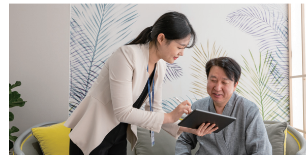
Мэргэжлийн координаторийн үйлчилгээ